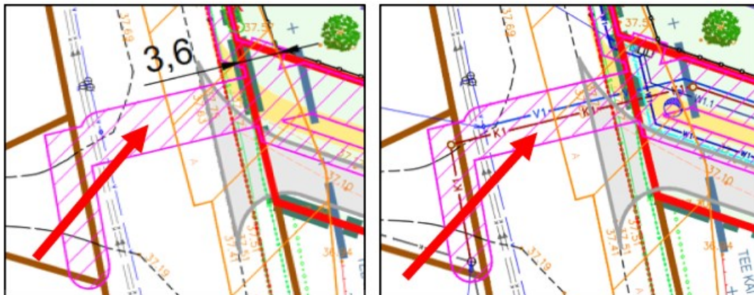
Joonis 3. Väljavõtted planeeringu põhijoonisest ja tehnovõrkude koondplaanist

Servituudivajadusega ala ulatuseks riigitee maaüksustel määratakse trassi teljest 1 m mõlemale poole (1+1 m).